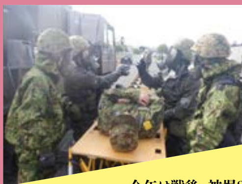
全国でいま、日本の戦場化を想定した演習が...