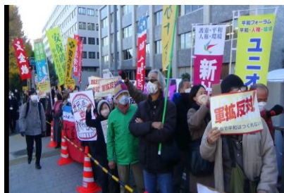
安保3文書の閣議決定に抗議 (昨年12月16日、首相官邸前)