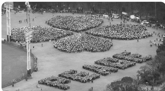
昨年の「3.20世界反戦共同行動」 大阪城公園では1万人の人絵文字の花が咲いた

イラクの選挙では「米軍の撤退期日を明確にせよ」と公約した政党が圧勝しました。しかし米軍に戦闘訓練を受けた大阪の自衛隊が占領を手助けするために今春、イラクに派遣されます。