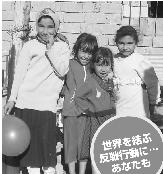
バグダッド南部の子どもたち