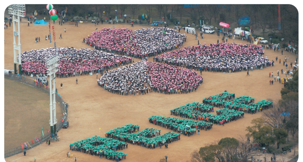
昨年の「3.20世界反戦共同行動」 大阪城公園では1万人の人絵文字の花が咲いた

イラクの選挙では「米軍の撤退期日を明確にせよ」と公約した政党が圧勝しました。しかし米軍に戦闘訓練を受けた大阪の自衛隊が占領を手助けするために今春、イラクに派遣されます。