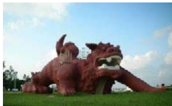
シーサー滑り台 宮古島・カママ嶺公園内